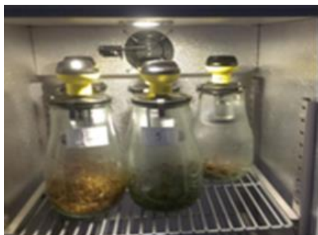
Rys. 1. Test AT 4 Fig. 1. AT 4 test

1 g ChZT/1 g smo [Own 1979]. Założono osiągnięcie produkcji metanu na poziomie około 2000-3000 ml CH 4 /butelkę przy uwzględnieniu 60% stężenia CH 4 w biogazie oraz, że z 1g ChZT zostanie osiągnięta produkcja metanu co najmniej na poziomie 395 ml CH 4 .