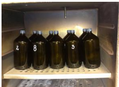
Rys. 2. Test BMP Fig. 2. BMP test

Konwersję ChZT substratu do metanu wyznaczono ze wzoru [Own 1979]: