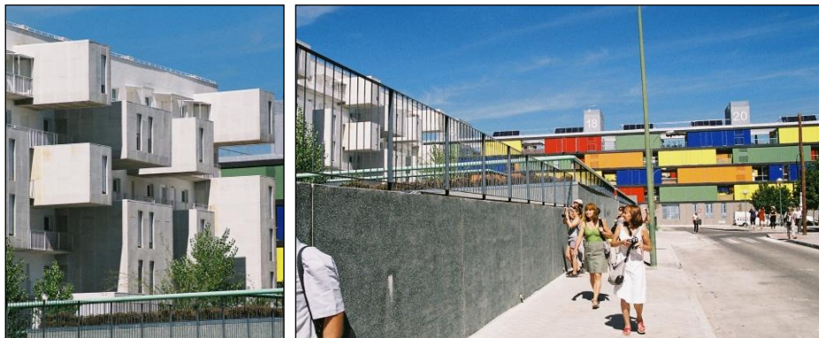
Fot. 8 i 9. Zrównoważone domy społeczne Carabanchel Carabanchel 20 i 21: C20 – głęboko urzeźbiona elewacja budynku i C21 – kolorowe poziomo przesuwne żaluzje są efektem technicznych innowacji [Wojtyszyn 2010]

Phot. 8 and 9. Sustainable social houses Carabanchel Carabanchel 20 and 21: C20 – deeply sculptured facade of the building and C21 – colorful horizontally sliding shutters are the result of technical innovation [Wojtyszyn 2010]