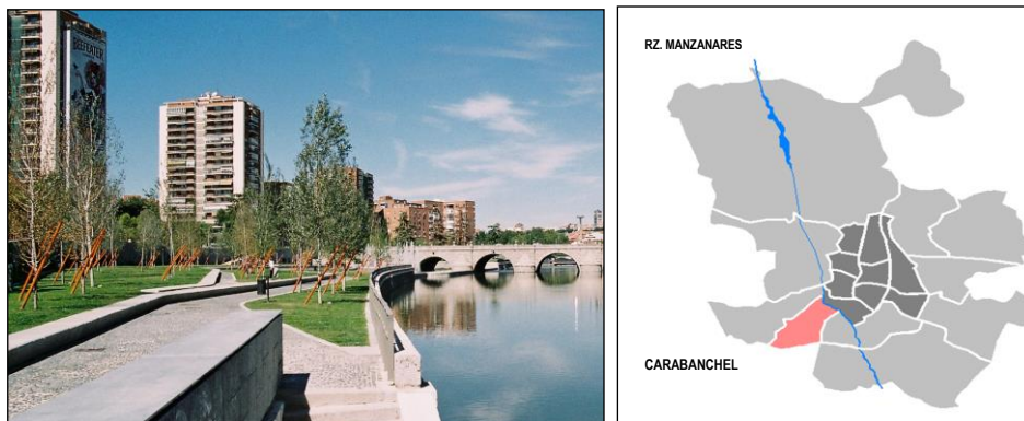
Fot. 1. Nowe tereny zieleni nad rzeką Manzanares, Madryt [Wojtyszyn 2010] Phot. 1. New green coastal areas of the river Manzanares [Wojtyszyn 2010]