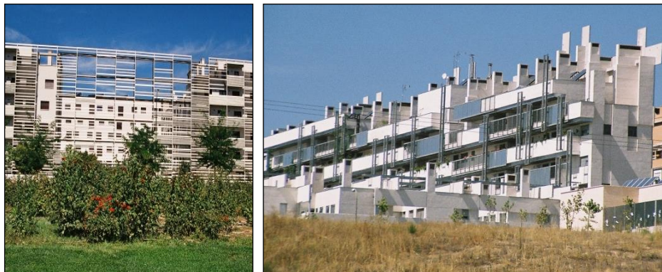
Fot. 3 i 4. Zrównoważone domy społeczne Carabanchel 19 i 11: C19 – elewacyjny ciąg regulowanych żaluzji poziomych i C11 – mauretański system wentylacji kominowej kreują architekturę budynków [Wojtyszyn 2010]

Phot. 3 and 4. Sustainable social houses Carabanchel 19 and 11: C19 – string elevation adjustable horizontal blinds and C11 – Moorish tower ventilation system create the architecture of buildings [Wojtyszyn 2010]