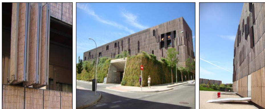
Fot. 5, 6 i 7. Zrównoważony dom społeczny Carabanchel 16 – Bambusowe żaluzje ruchome kreują architekturę elewacji budynku [Wojtyszyn 2010]

Phot. 5, 6 and 7. Sustainable social house Carabanchel 16 – Bamboo, movable shutters create the architecture of the building facade [Wojtyszyn 2010]