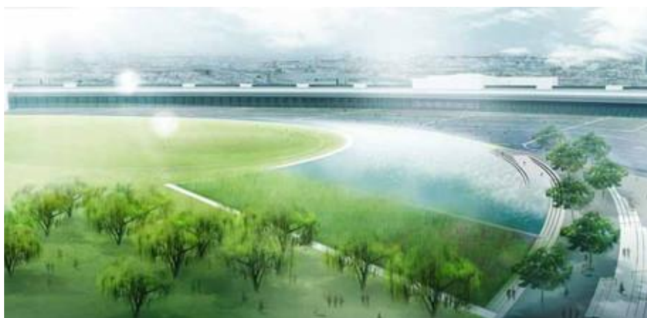
Fot. 1. Cztero-hektarowy zbiornik retencyjny z promenadą widokową. Phot. 1. 4-hectare reservoir with the scenic promenade.

Zabudowania starego lotniska liczą w sumie 300.000 m 2 i są nadal jednymi z największych na świecie. Od 2009 roku służą jako miejsce targów, festiwalu, eventów. Do tej pory w sumie około sto firm wynajmuje powierzchnię równą 70.000 m 2 . Głównymi najemcami są projektanci, muzycy, przedstawiciele bran-