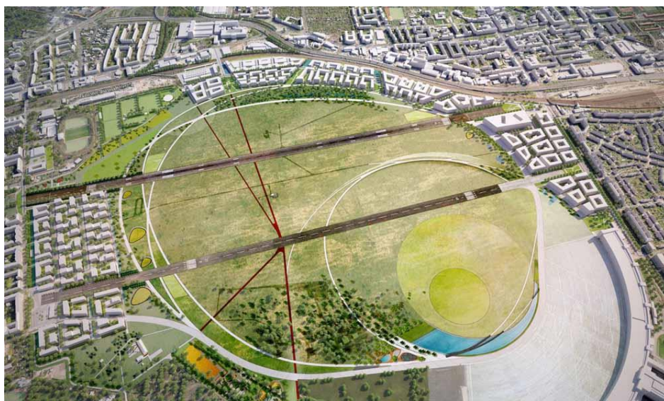
Fot. 1. Master Plan – Park wolności Phot. 1. Master Plan – Freedom Park